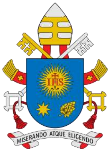
Герб Его Святейшества Папы Франциска

An Vatikañ biz walltelet kaptor katholixiant ķerkve. Nařvant Pontjifik anbizen 76-ařnant Argentinant štattziven, ark-biskop Buenos-Ayres unt Primas Argentinæ Jorge Mario Bergoglio. Æn biz šę atvętet nōm Franciscus.