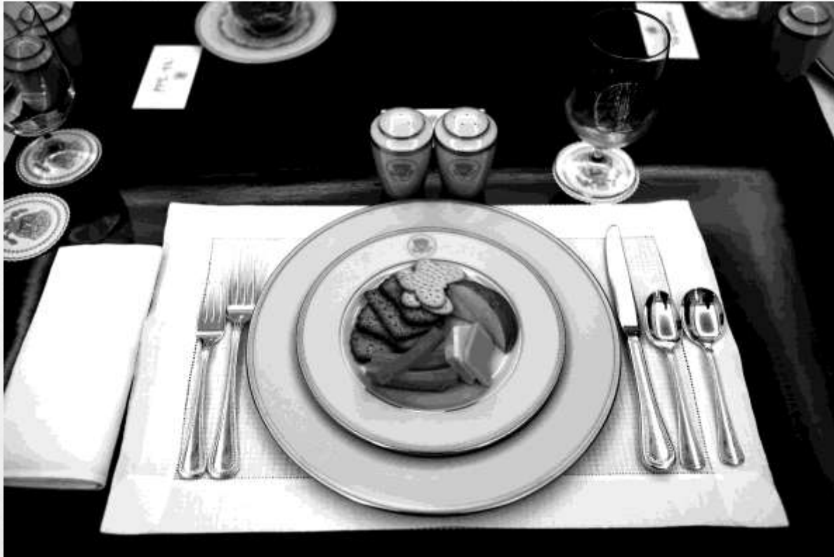
Учебная сервировка стола