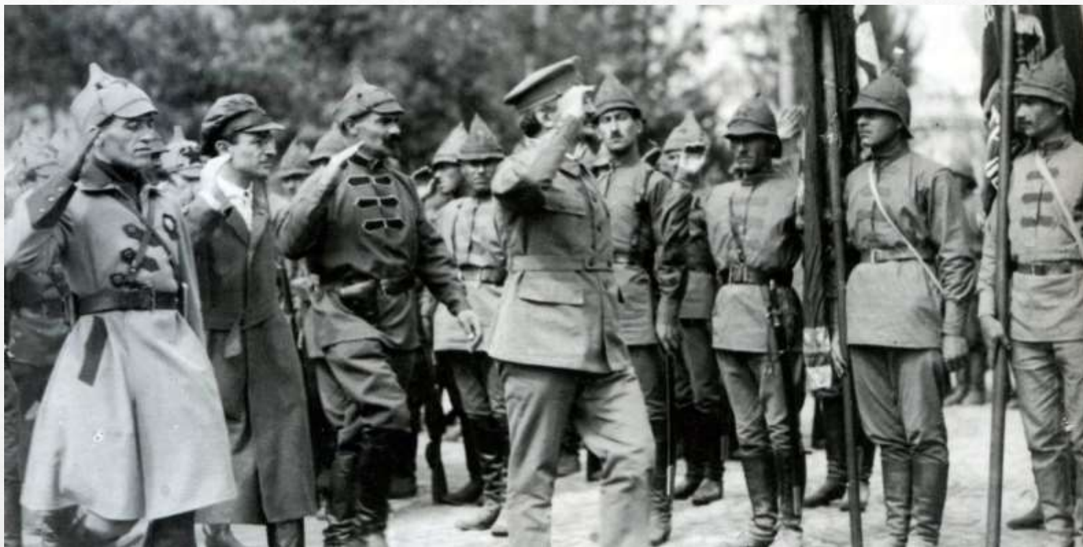
Первые части Красной Армии