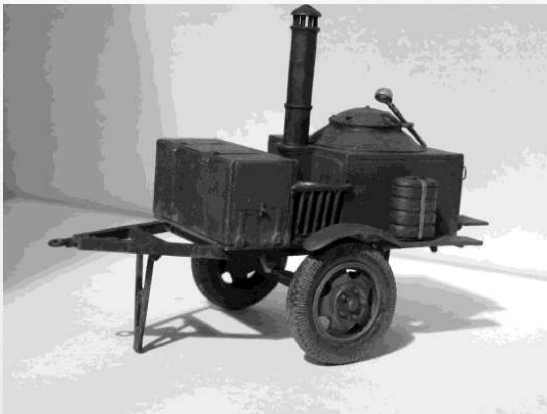
Кормилица на передовой