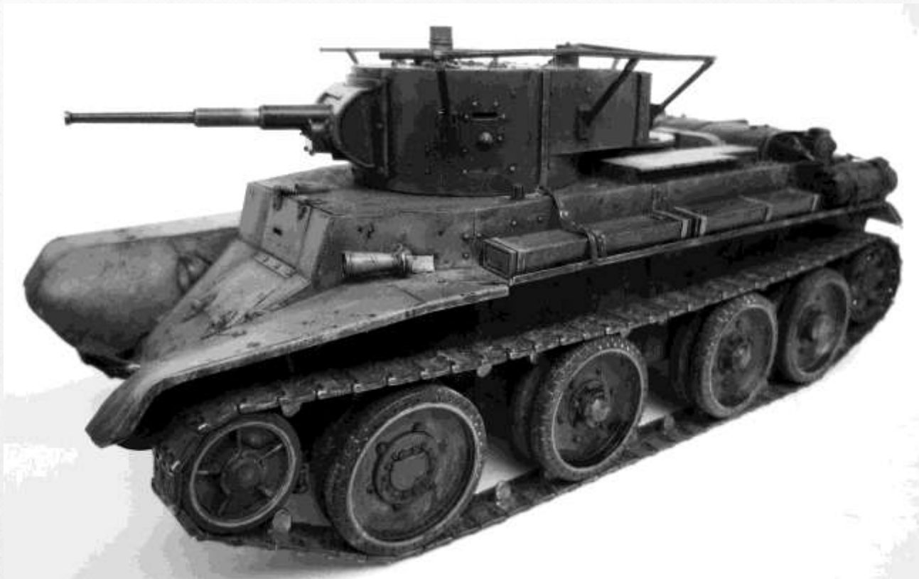
Танк БТ-7 командирский