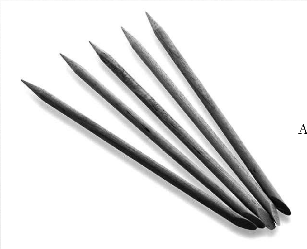
Апельсиновые палочки для тайнописи