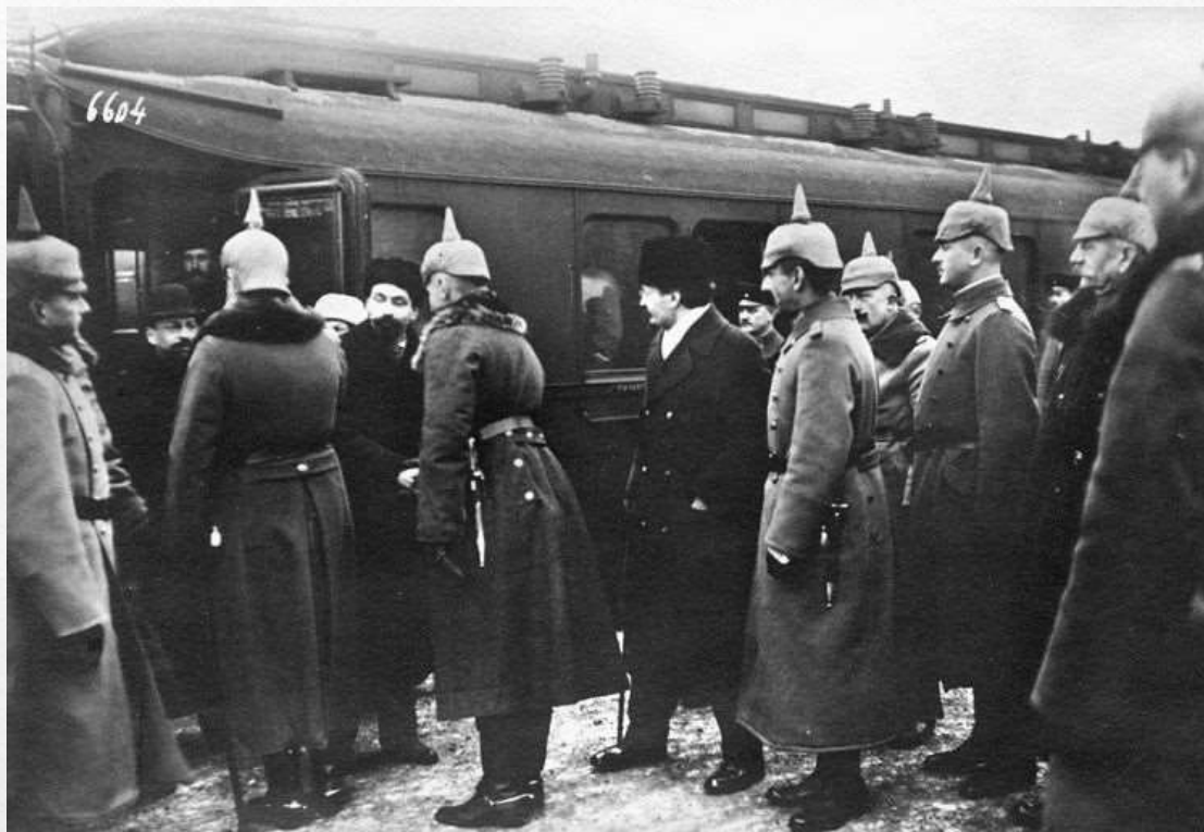
Начало мирных Брест-Литовских переговоров