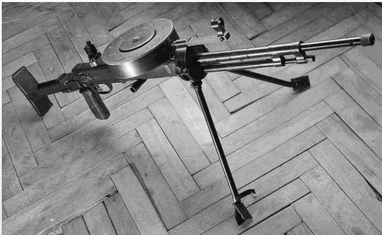
Ручной пулемет Дегтярева танковый