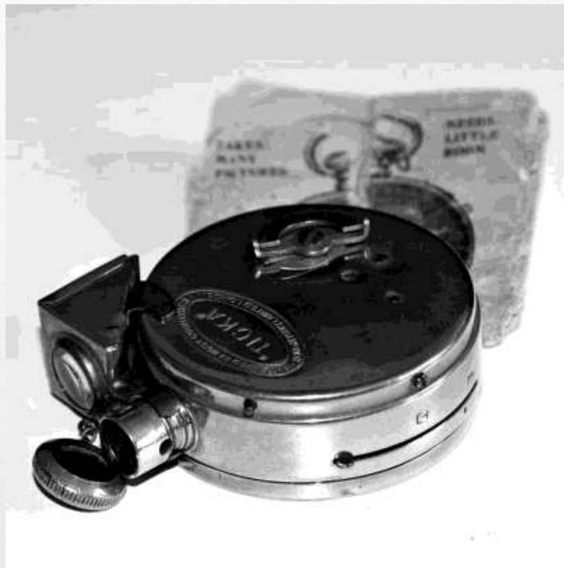
Фотоаппарат в часах фирмы Тика