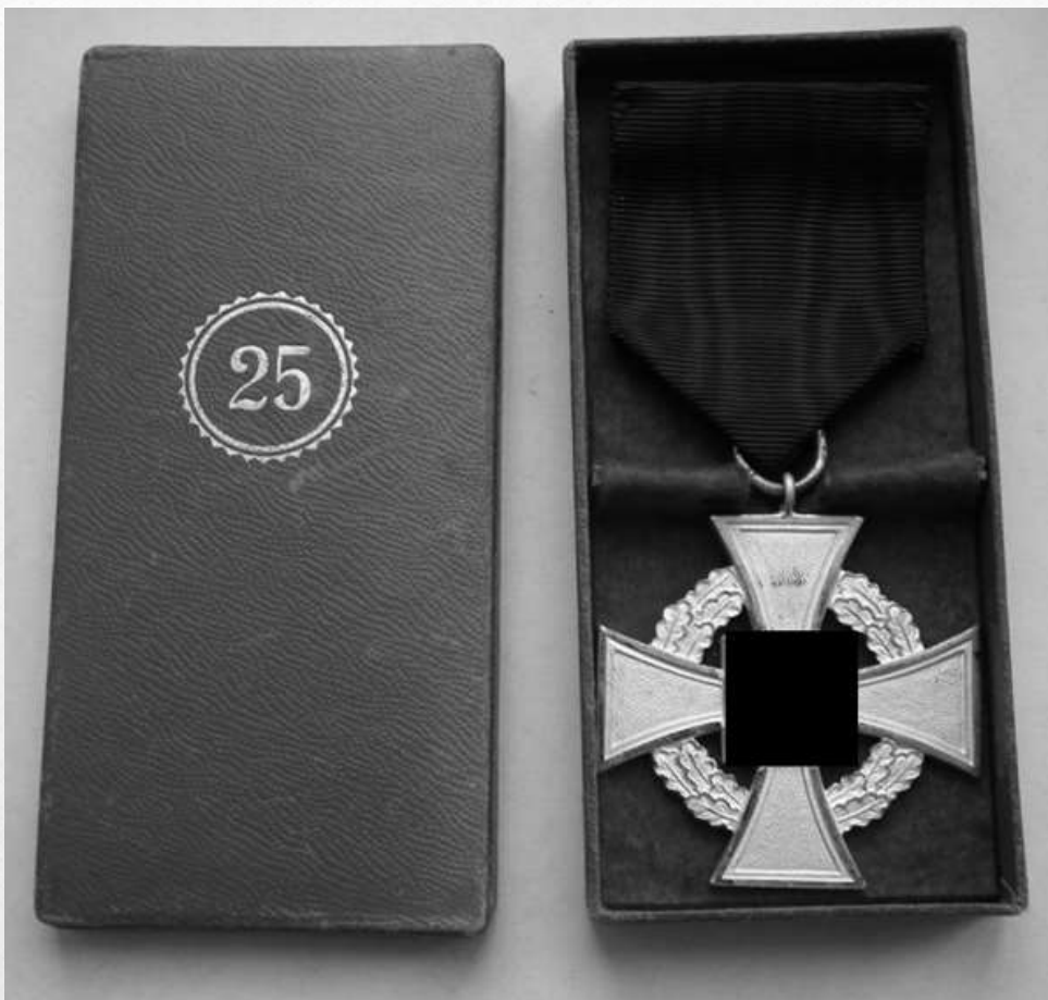
Крест за 25 лет безупречной службы