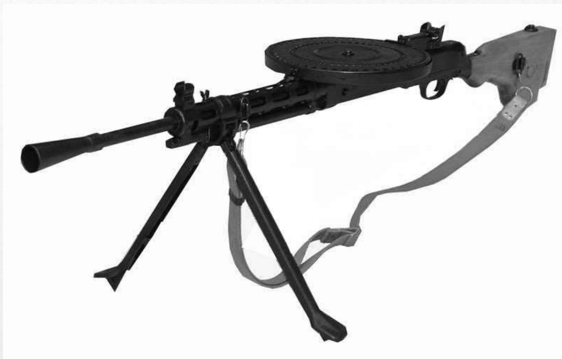
Ручной пулемет ДП (Дегтярева пехотный)