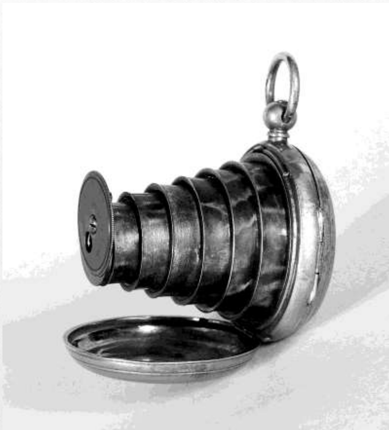
Фотоаппарат в часах