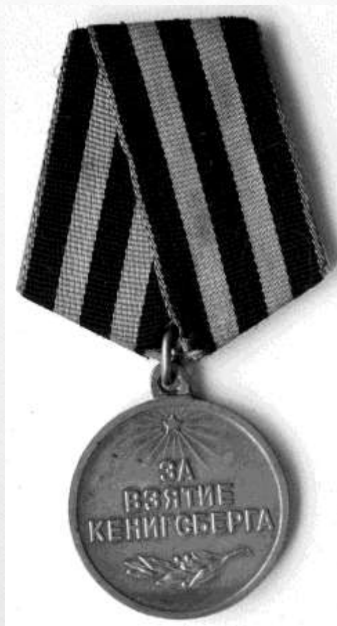
Медаль За взятие Кенигсберга