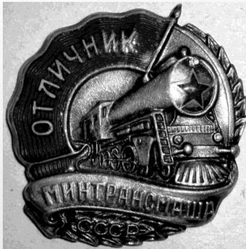
Знак Отличник Минтрансмаша