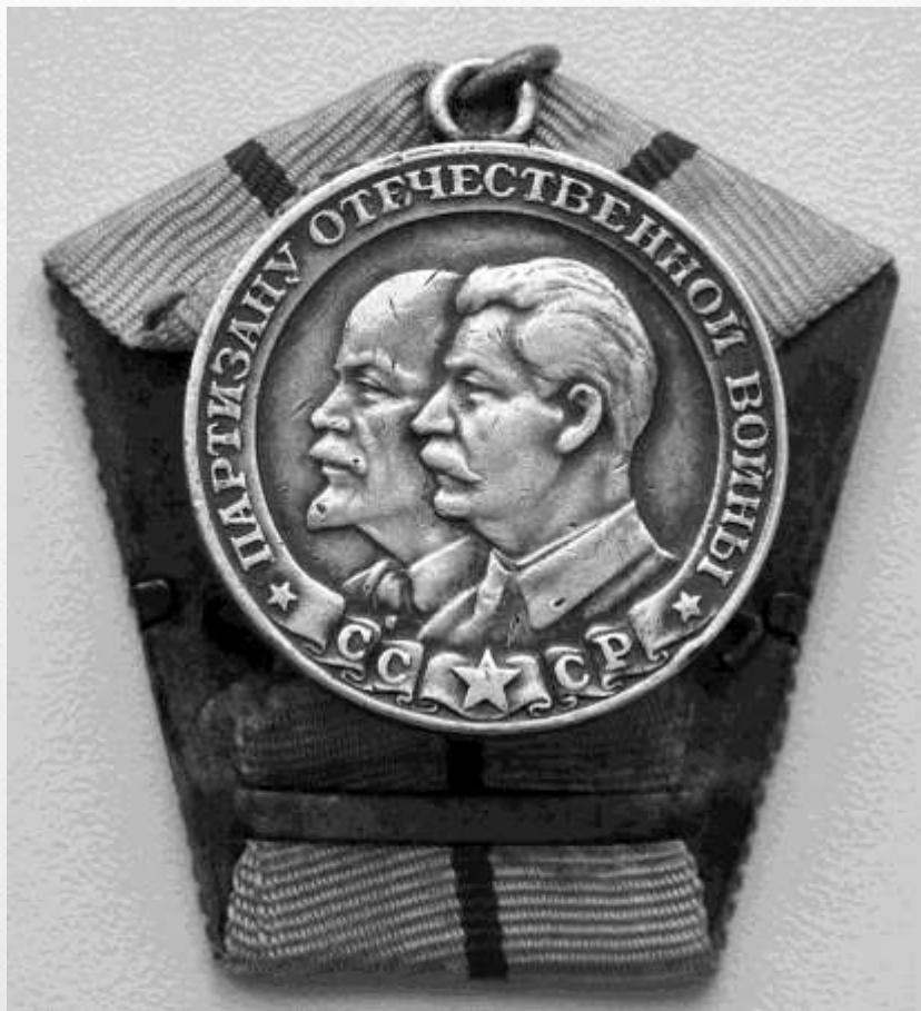
Медаль Партизану Отечественной войны 1 степени