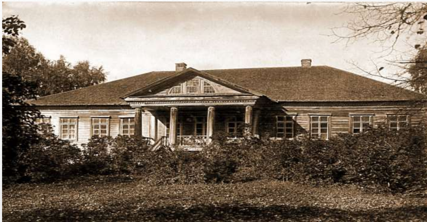
Родовое гнездо Гогенхеймов