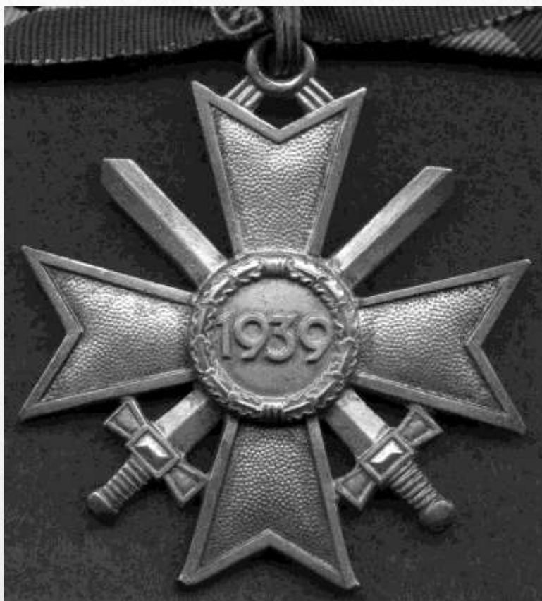
Рыцарский крест Военных заслуг