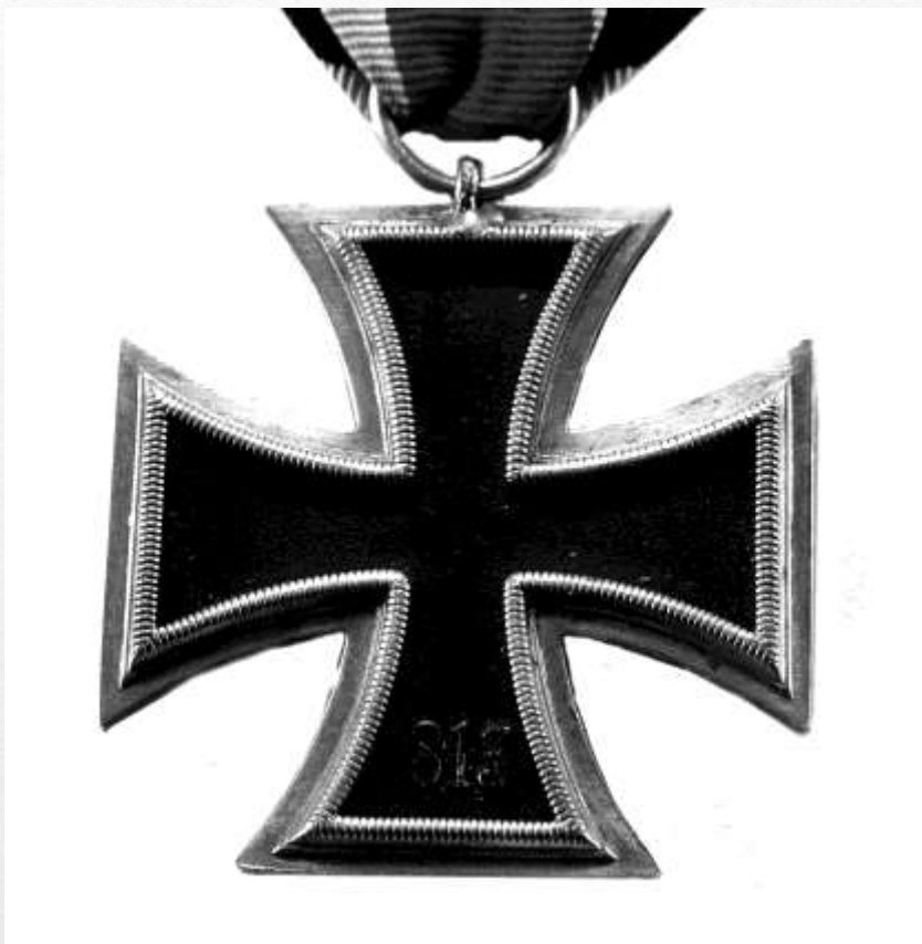
Орден Железный крест 2 класса