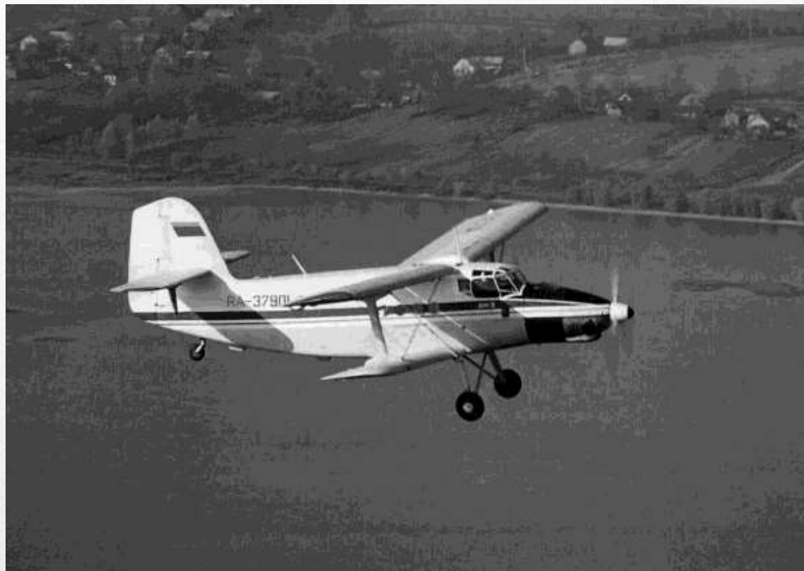
Самолет АН-3Т, побывавший на Южном полюсе