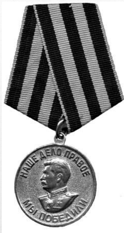
Медаль За победу над фашистской Германией