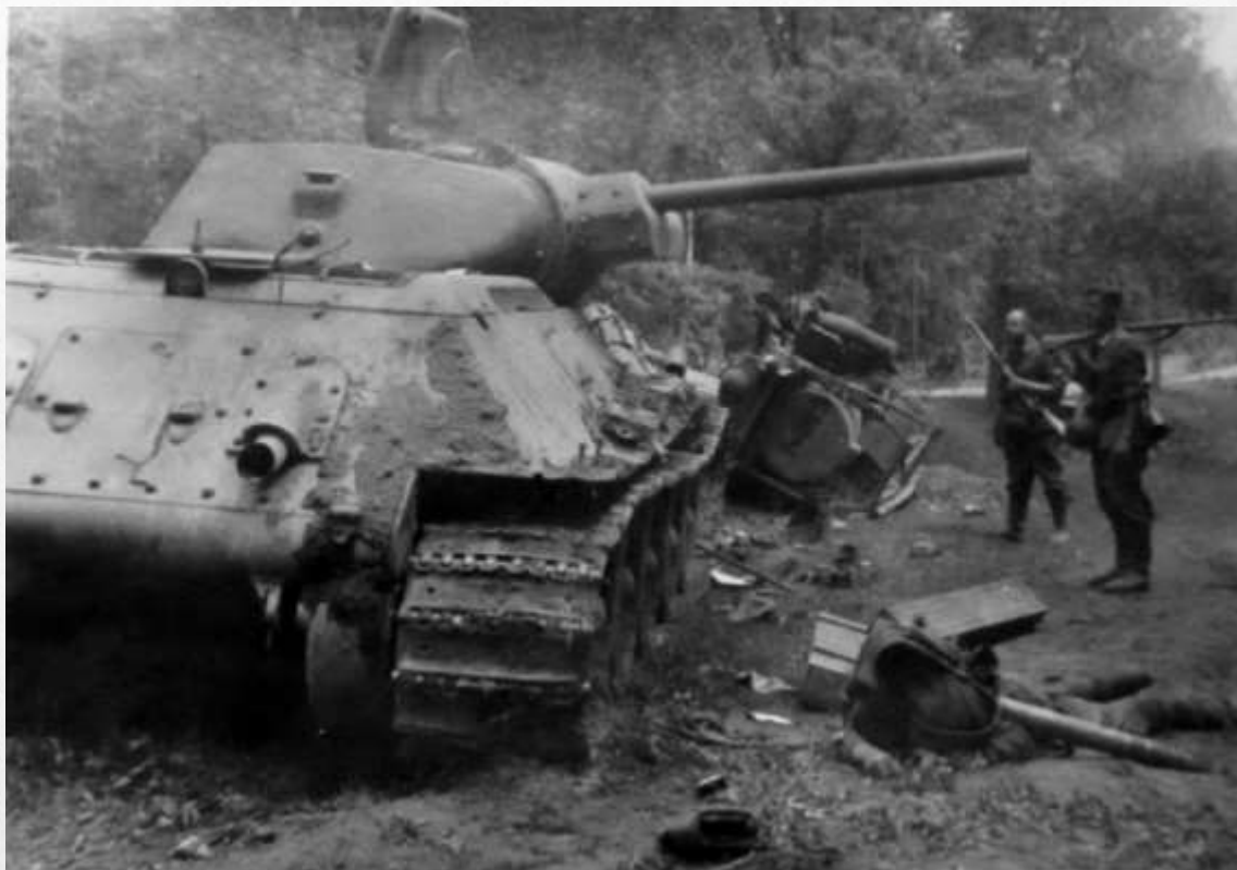
Танк Т-34, разметавший колонну немецких войск