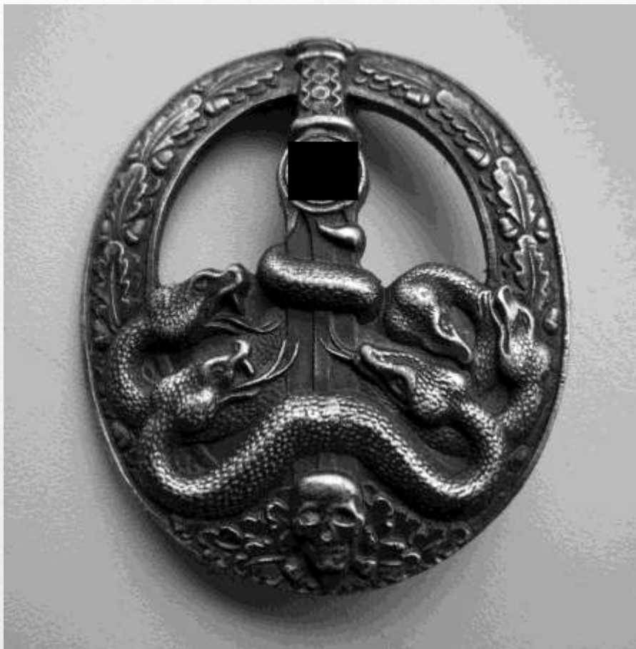
Гитлеровский знак За заслуги в борьбе с партизанами