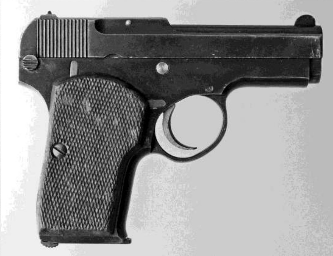
Пистолет Коровина для партийных и советских работников