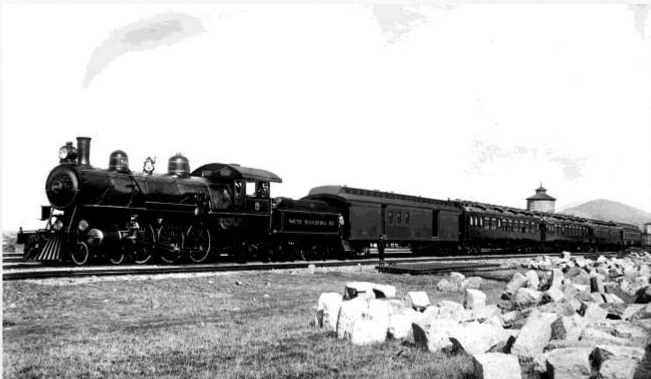
Поезд дальнего следования на ТСЖМ