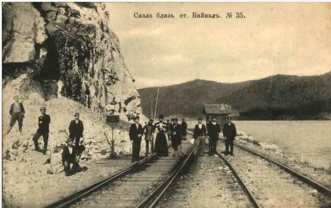
Участок Транссибирской железнодорожной магистрали (ТСЖМ) на Байкале