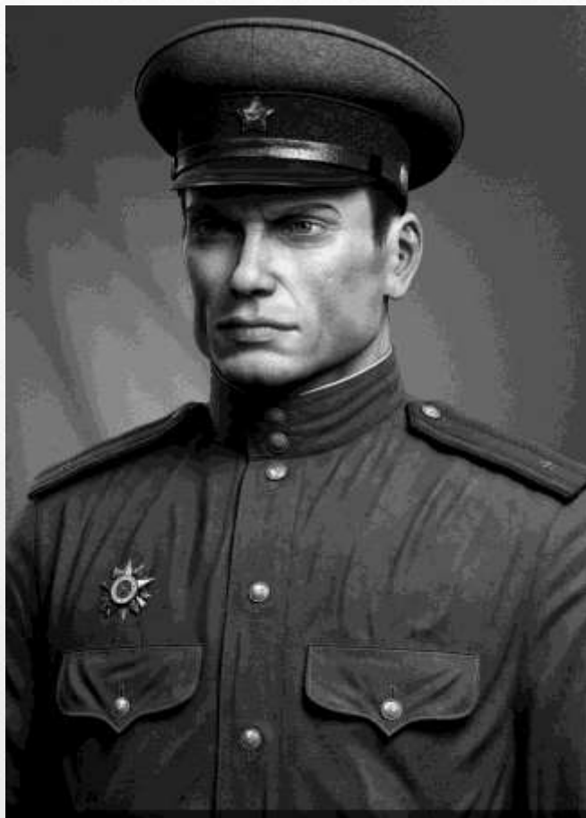
И. Гогенхейм в конце войны