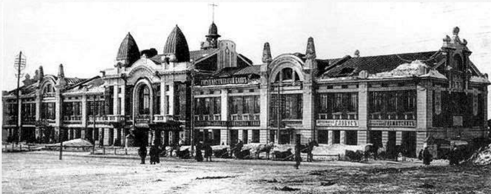
Железнодорожный вокзал в городе Новониколаевске