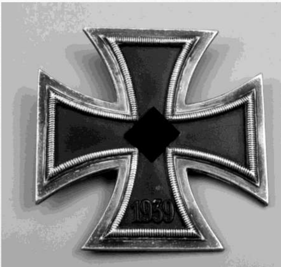
Орден Железный крест 1 класса