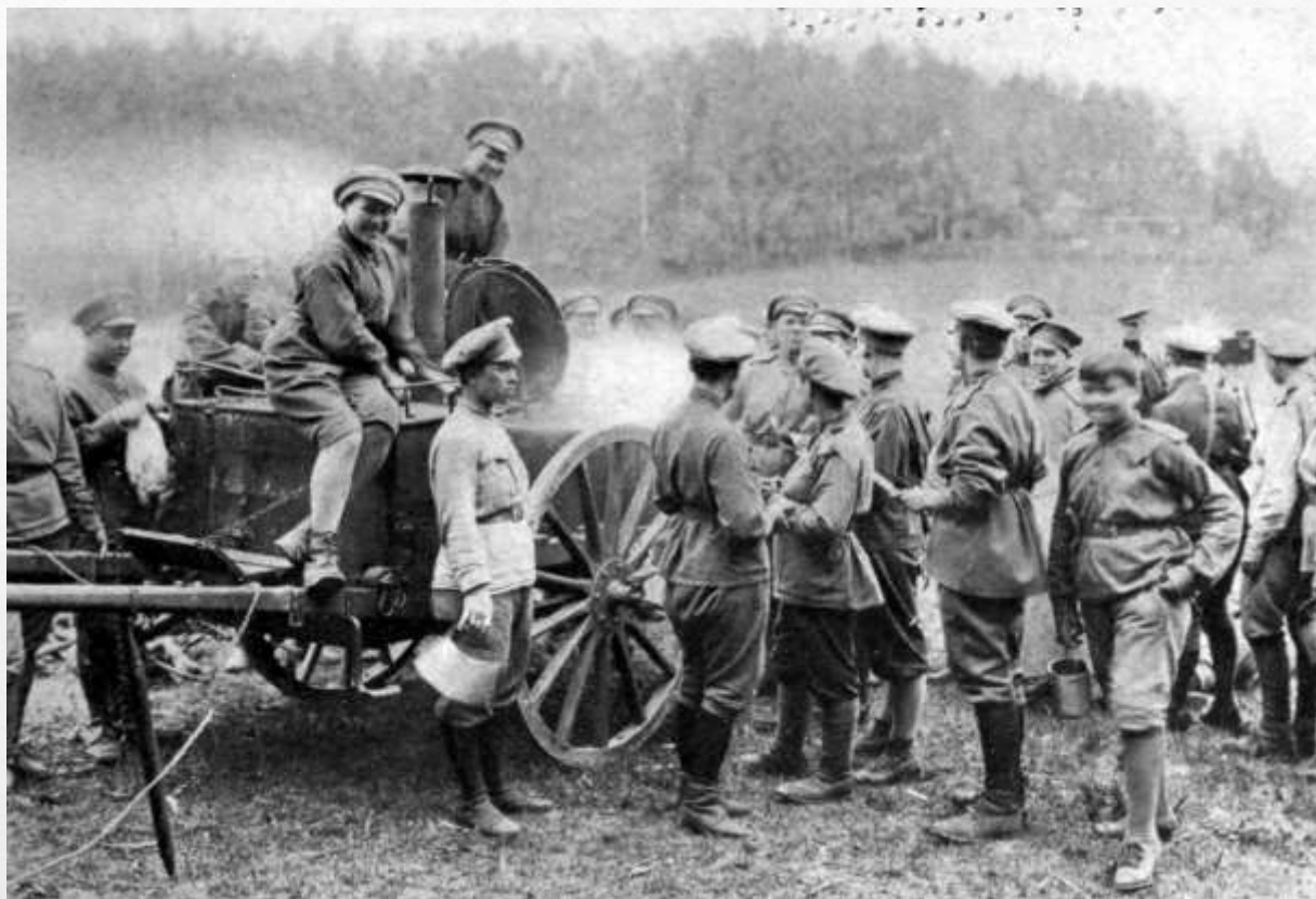
Полевая кухня и кухонное сообщество