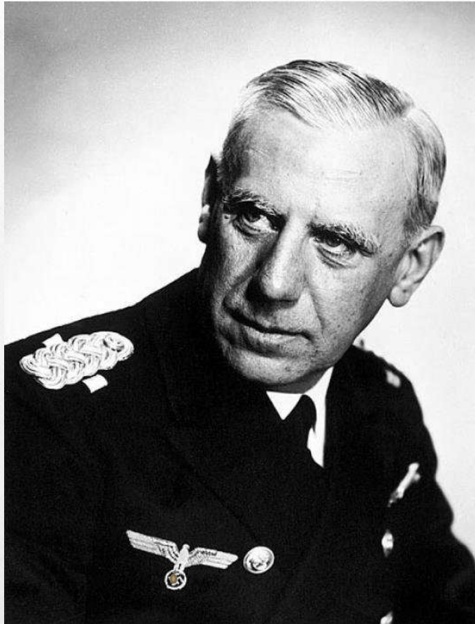
Руководитель военной разведки (Абвера) адмирал Канарис