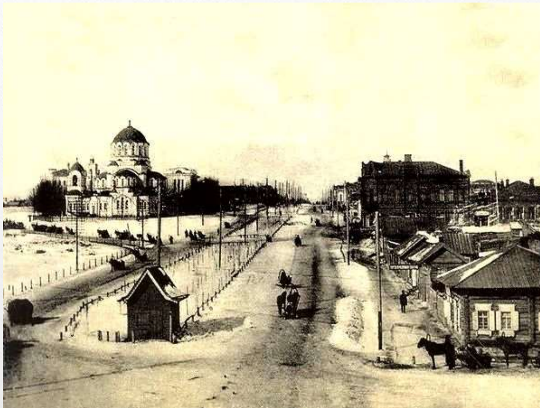
Город Новониколаевск (нынешний Новосибирск)