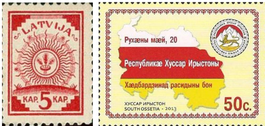
Рис. 2. Слева – марка с указанием названия государства Латвия; справа – марка непризнанного государства Республика Южная Осетия с указанием названия государства и гербом

Номинал почтовой марки. Проставление номинала почтовой марки определяется ее основной функцией, а именно удостоверением факта произведенной отправителем оплаты всех почтовых сборов. Но-