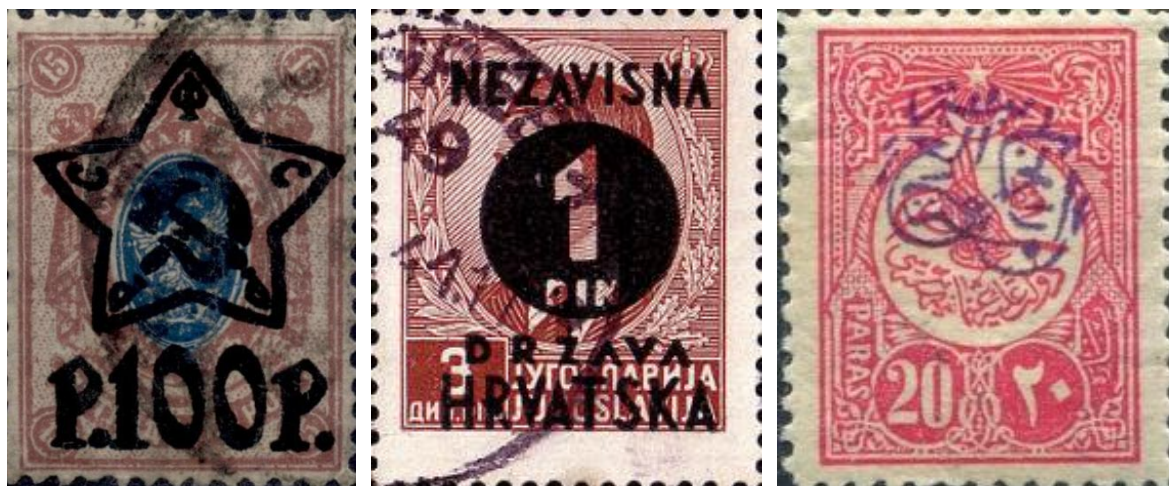
Рис. 5. Примеры марок с надпечатками: слева – надпечатка нового номинала; по центру – надпечатка Независимого государства Хорватия на марке с изображением последнего короля Югославии Петра II Карагеоргиевича; справа – надпечатка «Хакума аль Арабийя» 1 на марке Османской империи Арабского королевства Сирия 1913-1919 гг.

почтовую марку дополнительной надписи или графического символа. Проставляться надпечатка может как ручным, так и типографским способом. Причинами нанесения на почтовые марки надпечаток, как правило, является необходимость размещения на ней важной информации и при этом – отсутствие экономической либо временной возможности на выпуск нового тиража. К таким причинам относится изменение почтовых тарифов, введение доплат, изменение валюты страны, оккупация или деление территорий, ограничение зоны обращения марок и др. (рис. 5).