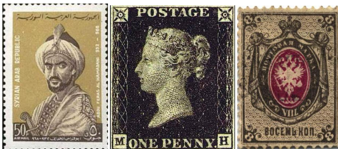
Рис. 3. Номинал марки: слева – арабскими и индо-арабскими цифрами; по центру – латинскими буквами; справа – кириллицей

минальная стоимость проставляется арабскими цифрами (или другими цифрами, принятыми в конкретном государстве) либо буквами (латинскими или другими, принятыми в государстве) (рис. 3).