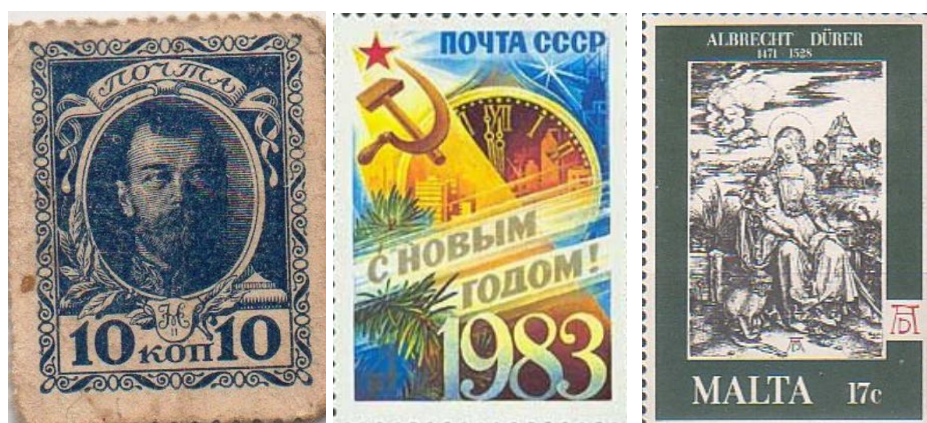
Рис. 6. Пример надписей на марках: слева – слово «Почта»; по центру – слово «Почта» и год выпуска марки; справа – имя художника

Надписи. При необходимости на почтовые марки наносятся надписи, имеющие существенное значение для выпускающего их в обращение эмитента. К таким надписям могут относиться слово «Почта», пометки, обозначающие тип марки (авиационная, морская, служебная, доплатная), год выпуска марки, название типографии и тираж выпуска, а также имя дизайнера (художника) марки (рис. 6).