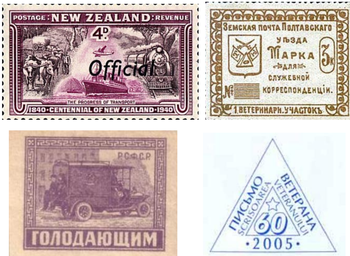
Рис. 4. Пример безноминальных марок: вверху – для служебной переписки, внизу слева – для благотворительности; внизу справа – для целей социальной пропаганды (надпечатка треугольника вместо марки)

Необходимо отметить, что без совокупности данных четырех элементов марка не может быть признана именно почтовой. При отсутствии одного из элементов марка не перестает быть маркой, но приобретает совсем иные свойства и предназначение. Существует большое количество марок, не имеющих номинала, такие марки не являются почтовыми (т. е. их нельзя приобрести в почтовых отделениях), а предназначены, например, для служебной переписки, благотворительности или несут в себе социальную пропаганду (рис. 4).