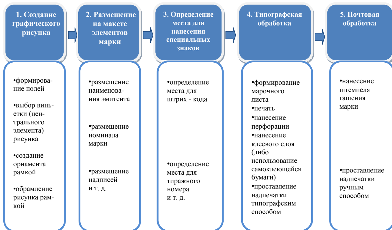
Рис. 7. Структура процесса создания почтовой марки

Для решения поставленного вопроса необходимо структурировать процесс создания почтовой марки (рис. 7).