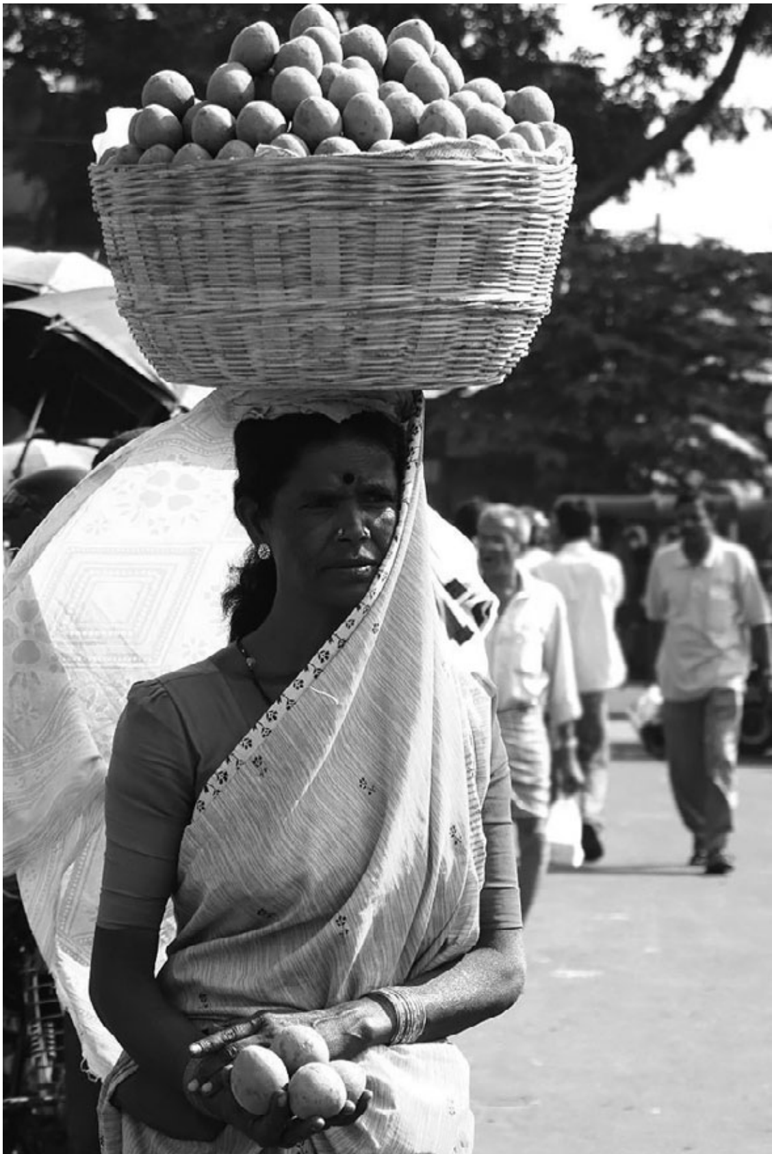
Рис. 2. Эта фотография показывает, почему мне так интересны кости. В традиционных обществах Индии, Африки и Америки точно так же носят на головах воду или зерно. В странах Леванта известна даже любовная песня о красавице с амфорой на голове. Пользы для здоровья тут куда больше, чем от специального лечения с целью укрепления костной ткани, но такая форма терапии не приносит прибыли фармацевтическим компаниям.