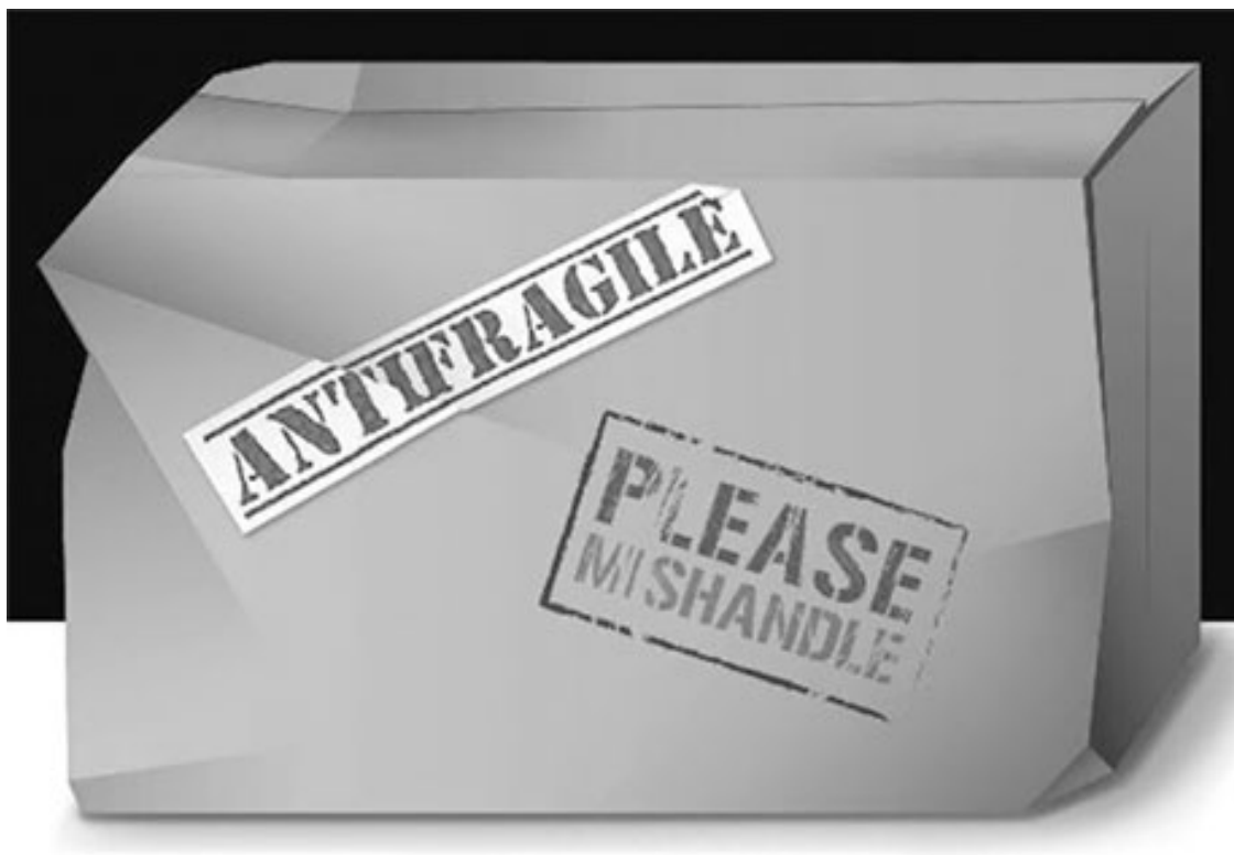
Рис. 1. Посылка, на которой отправитель написал: «Антихрупкое» и «Кантовать!». Ее содержимому нравятся стрессы и хаос. Ил. Giotto Enterprise / Джорджа Насра.

Чтобы удостовериться в том, что эта концепция нам чужда, повторите эксперимент: попросите людей на следующем деловом собрании, пикнике или сходке перед демонстрацией протеста назвать антоним слова «хрупкость» (не забывайте уточнять, что имеется в виду полная противоположность этому понятию, нечто с обратными свойствами и противоположной реакцией на стресс). Скорее всего, кроме слова «неуязвимое» вы услышите следующее: «то, что не ломается», «твердое», «крепкое», «эластичное», «сильное» и слова с компонентами «-стойкое», «-упорное», «-защитное» («ветрозащитное», «огнеупорное», «водостойкое») – если, конечно, опрашиваемые не слышали об этой книге. Люди ошибаются – и не одни только люди: целые области знаний путают одно с другим; эту же ошибку повторяют все словари синонимов и антонимов, которые я смог найти.