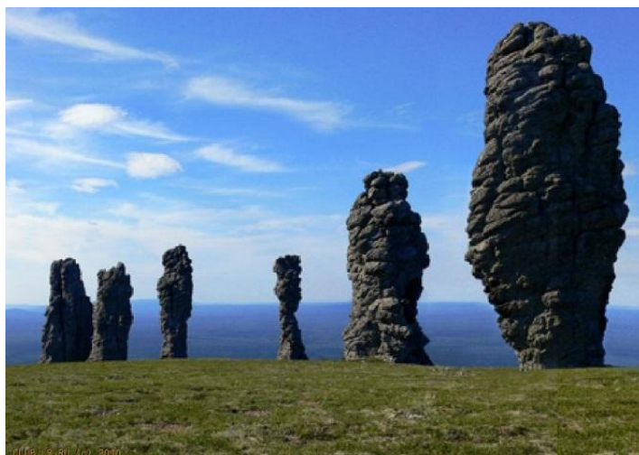
Рис. 1. Каменные изваяния Мань-Пупыг-Нёр .

По поводу превращения первых обитателей земли в пупыг ‘духов’, например, В. Н. Чернецов пишет: «Сначала были богатыри эрыг отырыт , которые также жили в ма кол ‘землянках’. Находимые черепки глиняной посуды принадлежат им. Они всё время воевали. Почти все были перебиты, а кто из них остался в живых, стали пупыг » [9, 150].