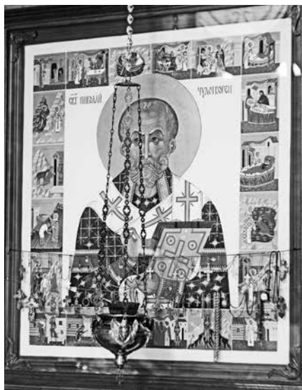
Икона св. Николая Чудотворца в самарской церкви св. мч. Иоанна Воина (нижний ряд — клейма с надписанием «Чудо о стоянии Зои Самарской»). 2018 г.

ночь 7 . Возможно, но могу тут врать. Хотя где это читала, тоже вспомнить не могу, так что на источник тебе не укажу. Вот именно легенда, которую все знают и никто не знает первоисточника [ЛЕЭ].