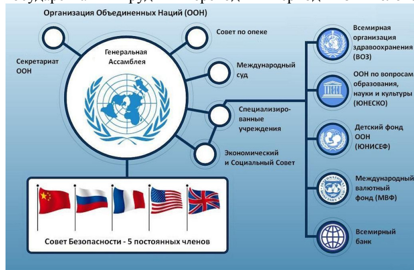
Рис. 1. Структура организации Объединённых Наций.

Организация Объединённых Наций, ООН — международная организация, созданная для поддержания и укрепления международного мира и безопасности, развития сотрудничества между государствами в трудный переходный период жизни человечества Земли.