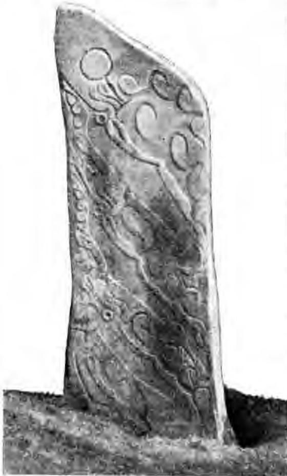
Рис. 1. Иволгинский камень, передняя сторона

Обе широкие плоскости Иволгинской каменной стелы, а также оба ее боковых ребра почти сплошь покрыты тщательно выбитыми, углубленными изображениями со сглаженной, лишь слегка шероховатой поверхностью, отчетливо выделяющимися на ровном возвышенном фоне камня. Глубина высекания на всех изображениях почти совершенно одинакова: она равна примерно 0,4—0,3 сантиметра. Техника высекания слегка напо-