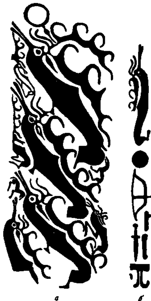
Рис. 2. Изображения на Иволгинском камне.

У обеих фигур изображены поднятые вверх дугообразные шеи и длинные, неуклюжие головы, раздвоенные на конце, подобно оленьим, но по