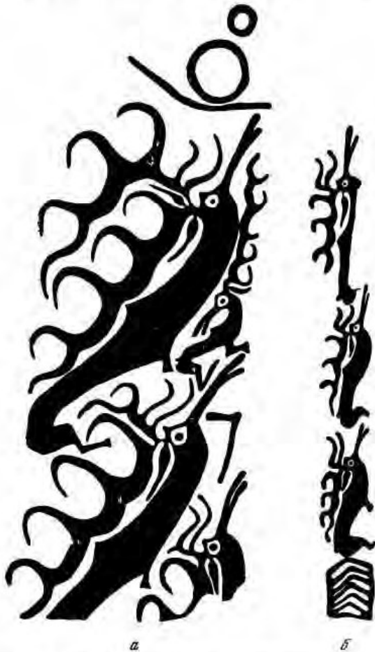
Рис. 3. Изображения на Иволгинском камне.

На противоположной широкой плоскости плиты (рис. 3) в той же технике и манере изображены две боль-