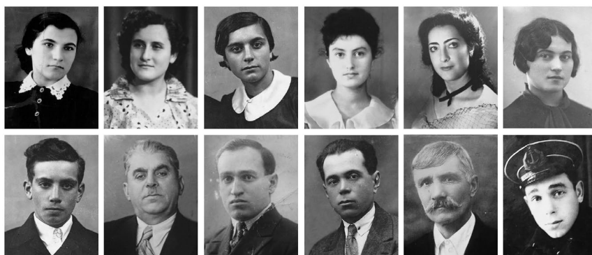
Рис. 1. Фотопортреты итальянцев Крыма XIX и XX вв. Фотографии из семейных архивов итальянцев Крыма. Фотоматериалы, собранные С. Дзани и Н. Хохловым в ходе экспедиций в Крым и в Италию в 2016–2020 гг.