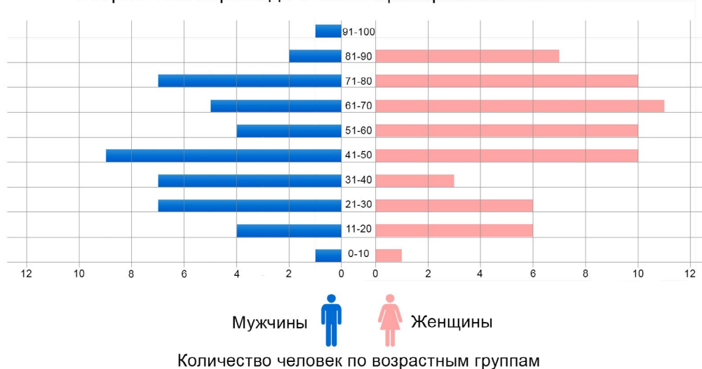
Рис. 3. Возрастная пирамида итальянцев Крыма на 2017–2019 годы.