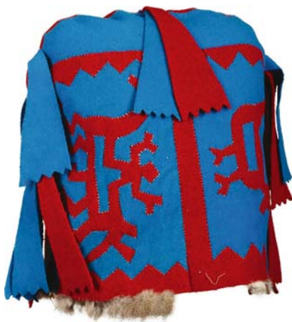
Рис. 15. Богатырский шлем. Размеры 35 × 36 см. Середина XX в. Поселок Патрасуй (Остеровы). Фото 2006 г.