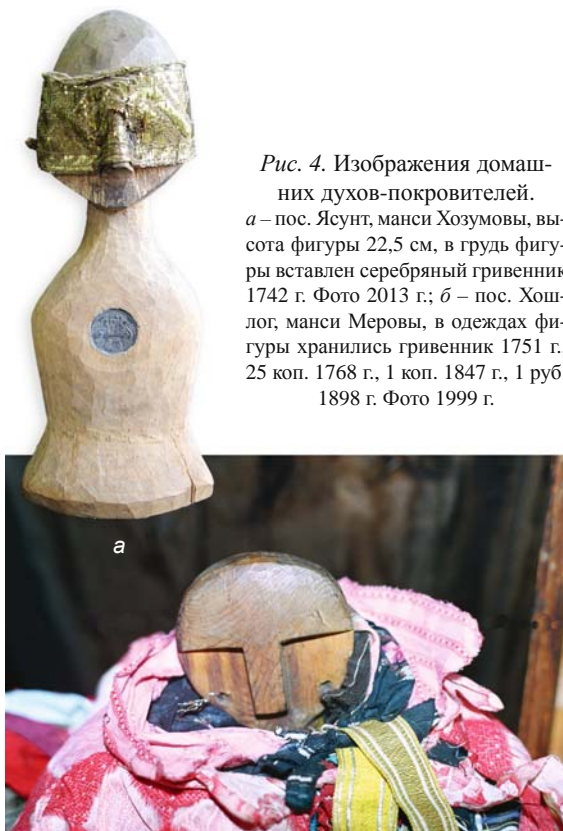
Рис. 4. Изображения домашних духов-покровителей. а – пос. Ясунт, манси Хозумовы, высота фигуры 22,5 см, в грудь фигуры вставлен серебряный гривенник 1742 г. Фото 2013 г.; б – пос. Хошлог, манси Меровы, в одежде фигуры хранились гривенник 1751 г., 25 коп. 1768 г., 1 коп. 1847 г., 1 руб. 1898 г. Фото 1999 г.

Фигуры духов-покровителей в современных домашних святилищах северных манси представлены в следующих вариантах: в суконной одежде с внутренней основой из дерева; в виде набора одежд без внутренней основы; привозные статуэтки или игрушки (чаще всего это всадник из дерева на лошади из папье-маше). Деревянные основы используются достаточно редко, встречаются две разновидности: бюст (рис. 4) или целая фигура с руками и ногами (рис. 5). Головы круглые или заостренные, вырезаны глаза, нос и рот. Длина подобных фигур варьирует от 10 до 30 см. В деревянной скульптуре встречаются и композиционные изображения, например, фигурка матери с лицом дочери на груди (рис. 6). Фигуры духов-покровителей,