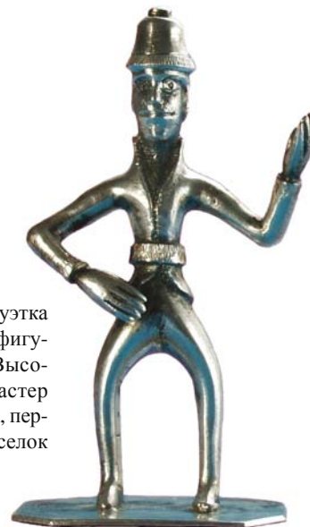
Рис. 9. Серебряная статуэтка мужчины – вложение в фигуру духа-покровителя. Высота статуэтки 6,8 см. Мастер П.Т. Брюханов, Тобольск, первая четверть XIX в. Поселок Ясунт. Фото 1999 г.