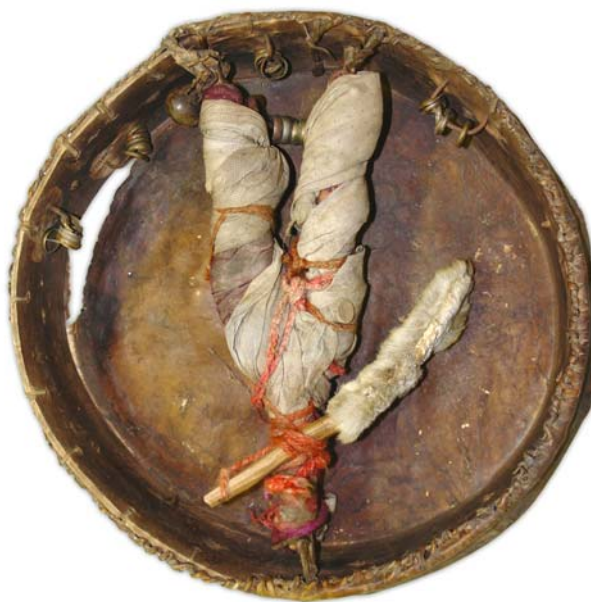
Рис. 24. Шаманский бубен. Диаметр 50 см. Середина XX в. Поселок Ясунт (Немдазины). Фото 2007 г.

За последние годы описано шесть бубнов (по одному в поселках Верхнее Нильдино, Ломбовож, Щекурья, три в пос. Ясунт). Для примера дадим описание бубна, хранящегося на чердаке дома Немдазиных в Ясунте. Он круглой формы, диаметр 50 см, ширина обечайки 9 см, длина рукояти 42, колотушки – 30 см. Рукоять вильчатая, привязана кожаными ремешками к обечайке, обмотана лоскутами разноцветной ткани с завязанными монетами, поверх них красным шерстяным шнуром. Между вилками перемычка из 12 медных и оловянных колец на кожаном шнурке; к концу одной вилки привязан шаркунец. Мембрана бубна из оленьей кожи прикреплена к обечайке кожаным гжугтом. На внешней стороне обечайки укреплены 12 деревянных столбиков-резонаторов, на внутренней вбиты четыре железные скобы, на каждую из которых надето по пять медных колец. Колотушка с загнутой ударной частью, обшитой мехом оленя, привязана к рукояти бубна (рис. 24).