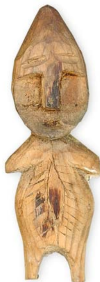
Рис. 5. Фигура семейного духа-покровителя Ромбандеевых. Высота фигуры 30 см. Глаза были закрыты серебряными пятакими эпохи Екатерины II, зашитыми в темную ткань. Поселок Хошлог. Фото 2008 г.