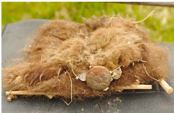
Рис. 21. Медвежья шкура (имда) на каркасе. В старину нос медведя закрывали серебряным блюдцем, здесь он закрыт крышкой от баночки из-под вазелина и двумя монетами выпуска 1920-х гг. Поселок Хурумпауль (Хозумовы). Фото 2010 г.