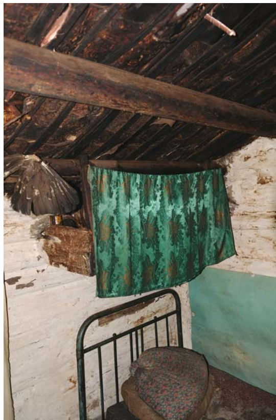
Рис. 1. Священная полка, укрытая занавеской. Старица Луи-пауль-урай. Фото 2008 г.

В настоящее время дома манси в небольших селениях представляют собой бревенчатые избы русского типа с чердачным помещением. Семейные фетиши хранятся в двух местах. Первое располагается в жилой комнате: в правом или левом углу на высоте ок. 1,5 м от пола устроена т.н. священная полка, укрытая занавеской (рис. 1)*; к редким вариантам относится прикрепленный к стене небольшой шкаф (рис. 2). На полке (в шкафу) стоят небольшие сундучки, чемоданы, лежат мешки, в которых находится семейная атрибутика и изображения духов-покровителей. В последние годы сакральность угловой полки стала уменьшаться, сюда нередко кладут и обычные хозяйственные вещи: элементы питания, лекарства, мелкий инструмент и пр. Второе место хранения ритуальной атрибутики внутри дома – чердачное помещение, куда вход женщинам запрещен (рис. 3). Здесь собраны «святые» вещи предыдущих поколений обитателей дома. Сундуки, ящики и чемоданы устанавливают на дощатом помосте у задней стены; на продольные перекладины