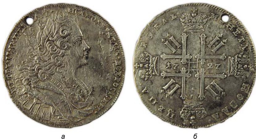
Рис. 18. Рубль Петра II. 1727 г. Старица Норколн-урай. Фото 2014 г. а – реверс; б – аверс.