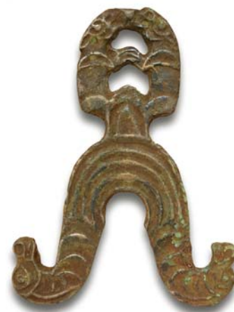
Рис. 19. Фигурный бронзовый подвес. Размеры 12 × 9 см. Предположительно X–XII вв. Старица Норколн-урай. Фото 2013 г.

XX вв. северными манси найдено немало образцов древнего бронзолитейного производства. Их воспринимали как материальные свидетельства существования легендарных богатырей-предков, а также как послание свыше, знак удачи и особой благосклонности к человеку со стороны небесных сил. На дне священных сундуков в последние годы удалось обнаружить неолитическое каменное тесло, бронзовые кельт, зеркало, фигурку зайца, подвес (рис. 19), серебряные очелье, наруч, три диска [Бауло, 2013, с. 38–41, 174–177].