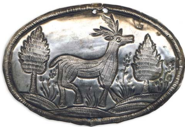
Рис. 17. Серебряная овальная пластина с изображением оленя. Размеры 10,6 × 6,7 см. Мастер П.Т. Брюханов, Тобольск, 1820-е гг. Старица Норколн-урай. Фото 2013 г.

В священные сундуки кладут также найденные необычные вещи, в т.ч. древние артефакты. В XVIII–