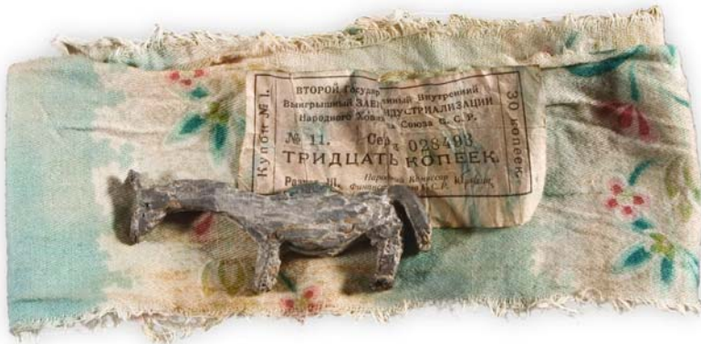
Рис. 23. «Заместитель» жертвы – свинцовая фигурка лошади. В живот вплавлена серебряная монета 1920-х гг. Фигурка вместе с купоном на 30 коп. была завернута в узкий лоскут ткани. Поселок Яныпауль (Самбиндаловы). Фото 2007 г.

занную из бересты (картона) фигурку коня; человек, обращаясь к богу с просьбой, давал клятву зарезать лошадь при первой возможности. Эти фигурки после жертвоприношения полагалось выбрасывать, но на практике чаще всего они продолжают храниться среди культовых атрибутов. В ряде случаев фигурку отливали из свинца (рис. 23) или использовали металлические статуэтки, приобретенные у купцов. Так, к категории «временной жертвы» можно отнести массивное литое медное изображение лошади из Хошлога. Эта скульптура с колокольчиком на шее, вместе с серебряным блюдом московской работы 1830 г., медными и серебряными монетами 1840–1890-х гг., была завернута в шелковый платок. Таким образом, «временная жертва» семейному духу-покровителю была увеличена за счет дополнительных подношений.