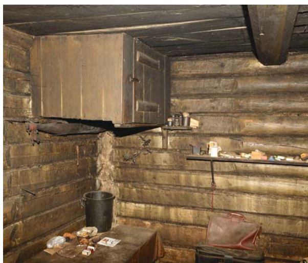
Рис. 2. Священная полка в виде шкафа. Поселок Верхнее Нильдино. Фото 2013 г.

вывешивают шкуры принесенных в жертву животных, мешки с поднесенными божествам платками, шкурки петухов; на полу можно увидеть медвежьи и олени череп, принесенные после праздников и жертвоприношений. Стена дома, расположенная напротив входа, у обских угров считается священной.