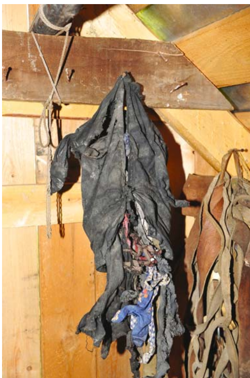
Рис. 10. Изображение Самсай-ойки на чердаке дома Хозумовых. Поселок Хурумпауль. Фото 2011 г.

Собраны новые данные о Самсай-ойке («За глазами старик», т.е. невидимый, находящийся в недоступном для зрения месте) – одном из духов, подчинен-