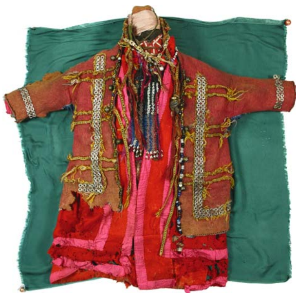
Рис. 7. Изображение Али-няхланг-эквы – духа-покровителя жителей пос. Верхнее Нильдино. Фото 2007 г. В ситец зашита серебряная монета 1780-х гг. Определены два основных периода формирования этого изображения: конец XVIII – конец XIX в. – время создания основы с косами, верхнего халата, украшенного металлическими бляхами, красного халата из парчи и шейно-нагрудного украшения; к концу XIX – XX в. относятся розовая рубашка, суконный халат, обшитый полосами шелка, и другие украшения [Богордаева, 2012].

у которых отсутствует сердцевина, а туловище создано за счет многочисленных рубашек, халатов и платков, надетых друг на друга, являются наиболее распространенными у северной группы манси (рис. 7). В одеянии божеств сохраняется и форменная военная одежда.