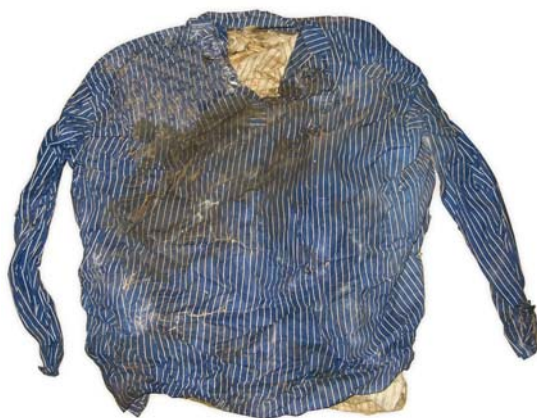
Рис. 12. Шаманский бубен в одежде – изображение духа-покровителя Пузиных. Поселок Ясунт. Фото 2007 г.