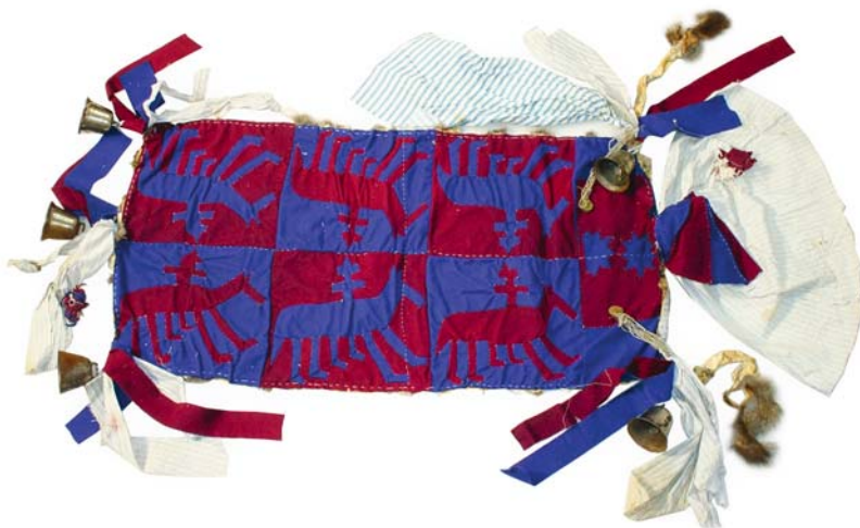
Рис. 16. Жертвенное покрывало с изображением шести всадников. Размеры 100 × 47 см. Середина XX в. Поселок Верхнее Нильдино (Вынгелевы). Материалы экспедиции 2006 г.

контексте стоит упомянуть замену традиционных берестяных выкроек для фигур всадников на бумажные (в частности, в Хурумпауле для них были использованы страницы журнала «Огонек»).