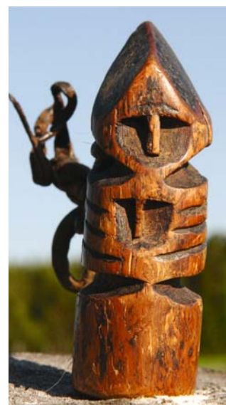
Рис. 6. Фигура духа-покровителя семьи Пузиных. Высота фигурки 8,2 см, в ней просверлено отверстие, через которое пропущен кожаный ремешок для подвешивания к шесту чума. Предположительно изготовлена в XIX в. Поселок Ясунт. Фото 2008 г.