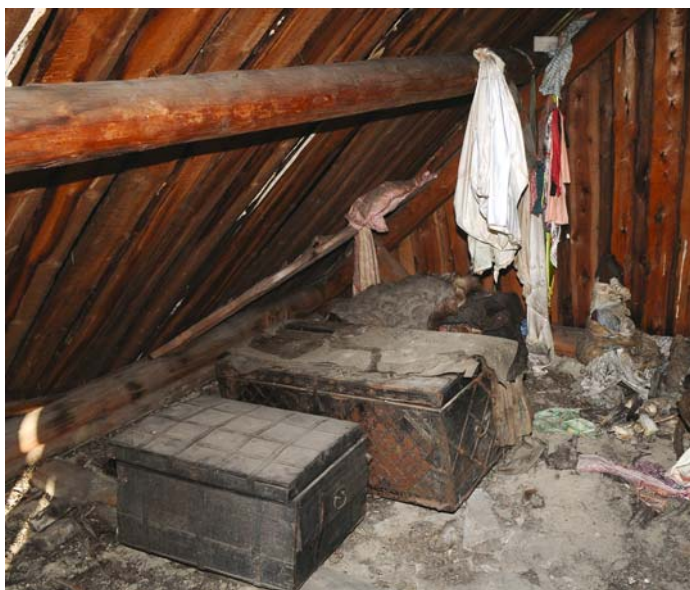
Рис. 3. Чердачное помещение со священными сундуками. Поселок Ясунт. Фото 2008 г.

Снаружи в ее левой части на высоте ок. 1,5 м от земли прикреплена еще одна священная полка: во время обрядов на нее ставят вынесенные из дома сундуки или ящики с фигурами духов-покровителей, здесь же помещается жертвенная пища и водка.