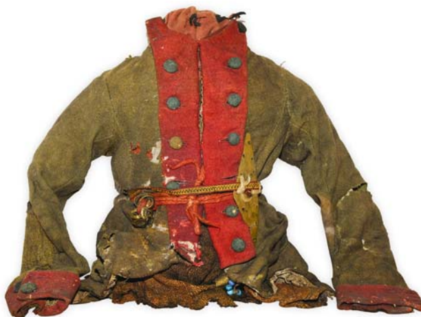
Рис. 8. Фигура духа-покровителя в солдатском мундире конца XVIII в. Поселок Хурумпауль. Фото 2009 г.

Из других изображений семейных духов-покровителей интересна описанная в Ясунте у манси Хозумовых большая антропоморфная фигура из множества халатов и рубаш, внутри которой находилась завернутая в сиреневый платок серебряная мужская статуэтка, изготовленная в Тобольске в начале XIX в. (рис. 9). В Хурумпауле в священный сундук была положена стеклянная новогодняя игрушка в виде девушки в сарафане, ее почитали как женскую богиню [Ба-