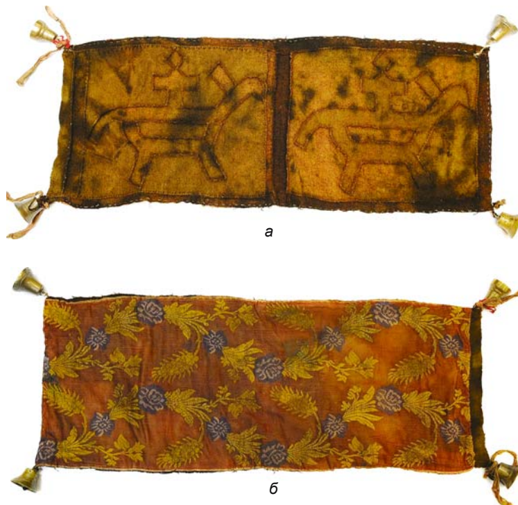
Рис. 14. Ритуальный пояс с изображением двух всадников. Размеры 126 × 48 см. Первая половина XIX в. Поселок Хошлог (Ромбандеевы). Фото 2008 г.

а – оборотная сторона; б – лицевое покрытие из ткани с ручной вышивкой.