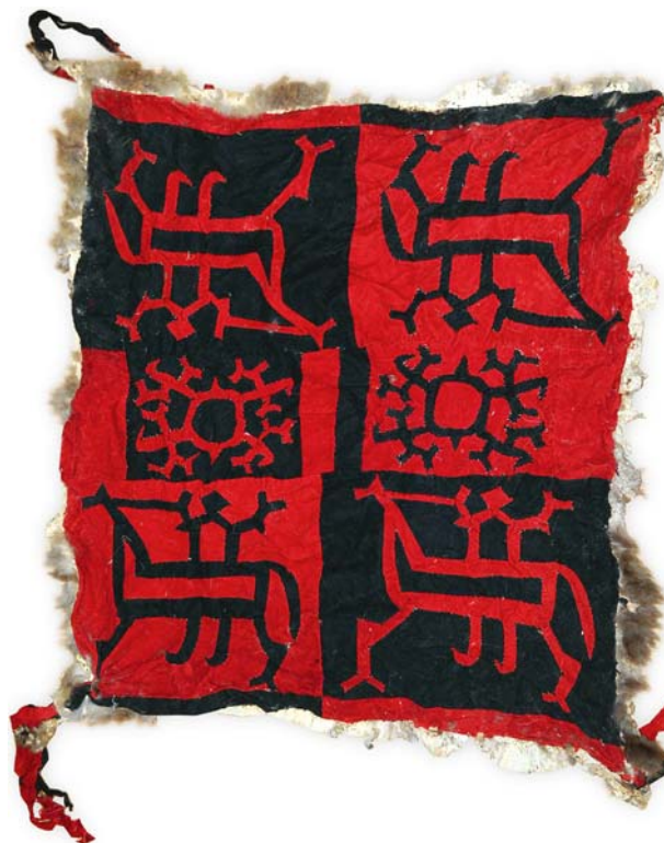
Рис. 13. Жертвенное покрывало. Размеры 88 × 75 см. Середина XX в. Поселок Верхнее Нильдино (Пакины). Фото 2008 г.

При всей каноничности данного вида культовой атрибутики у северных манси в последние годы отмечены ранее не встречавшиеся образцы: покрывало с четырьмя фигурами всадников и двумя солярными знаками (пос. Верхнее Нильдино, Пакины) (рис. 13), пояс с изображениями двух всадников, двух оленей, солнца и месяца (пос. Хурумпауль, Меровы), пояс с двумя фигурами всадников (пос. Хошлог, Ромбандеевы) (рис. 14) и шлем с восемью (пос. Верхнее Нильдино, Пакины), шлем, на котором изображены два всадника и две птицы (пос. Патрасуй) (рис. 15). На Северной Сосьве впервые зафиксировано покрывало с шестью фигурами всадников (пос. Верхнее Нильдино, Вынгелевы) (рис. 16). Следует отметить, что в обрядах используются покрывала, пошитые в основном в 1930–1980-х гг., вновь изготовленных не встречено. Данный факт позволяет с осторожностью (и сожалением) говорить об угасании, если не полном исчезновении уникальной традиции создания атрибутов Небесного всадника у манси. В этом же