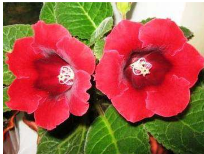
BLANCHE DE MERU