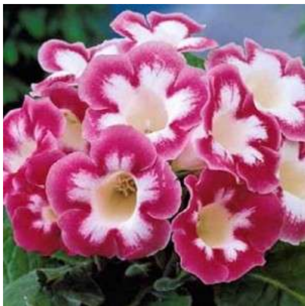
ETOILE DE FEU

Коллекция Ботанического Сада представлена следующими сортами: